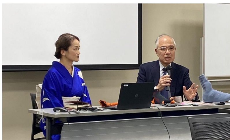
ディスカッション&質疑応答